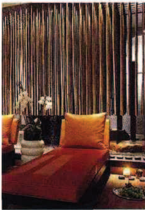
Ci-dessus, une cure de bien-être au spa Caudalie des Étangs de Corot. Surveiller sa silhouette à l'Usine Opéra (à droite).