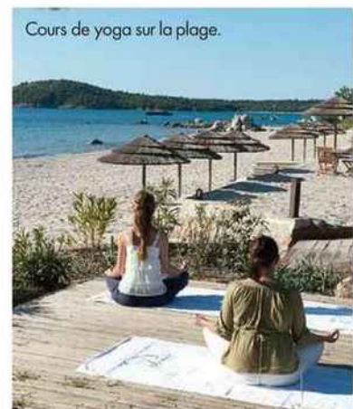
Cours de yoga sur la plage.

À partir de 212 € la chambre double. Sainte-Lucie-de-Porto-Vecchio (20). www.lepinarellu.com