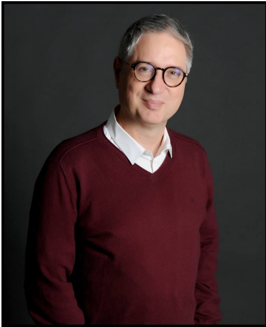
© Jean-Louis Poiroux, président fondateur de Cinq Mondes