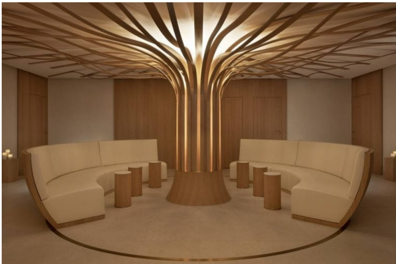
Spa Cinq Mondes Beau Rivage Palace Lausanne

J-L.P : Oui, les différentes périodes de fermeture successives ont éprouvé notre profession, les Spas et les instituts ; nous avons mis au point des protocoles sanitaires très stricts qui ont fait qu'aucun cluster n'a été signalé dans le cadre des Spas et des instituts. Cette crise nous a amenés aussi à dynamiser les ventes digitales de produits à travers nos sites dédiés, au même titre que le click and collect, et enfin nous avons développé des MOOC pour une formation continue des Spa thérapeutes en digital et distanciel. Donc, dans ces domaines, les confinements et autres contraintes réglementaires nous ont amenés à développer de nouveaux outils. Toutefois, notre première satisfaction et vocation est d'apporter bien-être et beauté à notre clientèle dans nos Spas et instituts.